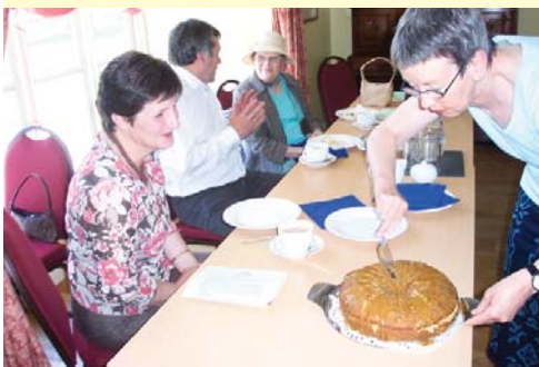
Mwynhau'r Te yng Nghraflwyn!

Yn ôl yr arfer uchafbwynt yr wythnos oedd y Te Dathlu a Diolch , ac eleni treuliodd odd-eutu 40 ohonom brynhawn godidog o braf yng Nghraflwyn yn Meddgelert. Ein siaradwr gwadd oedd y Cyngorydd Richard Parry Hughes - Arweinydd Cyngor Gwynedd (a chwarae teg iddo am fynychu a hithau yn ddiwrnod ei ben-blwydd!!).