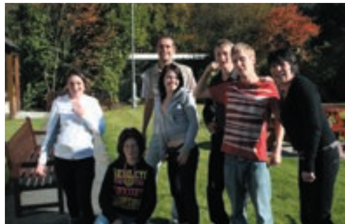
Theatr Fforwm Gisda fu'n perfformio ar y diwrnod